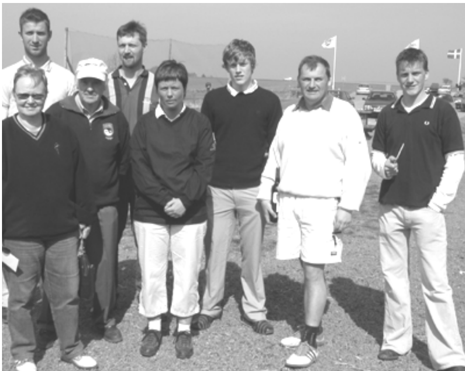
Præmietagerne ved årets åbningsmatch, Pallehus Reklame/Restaurant Algarve match