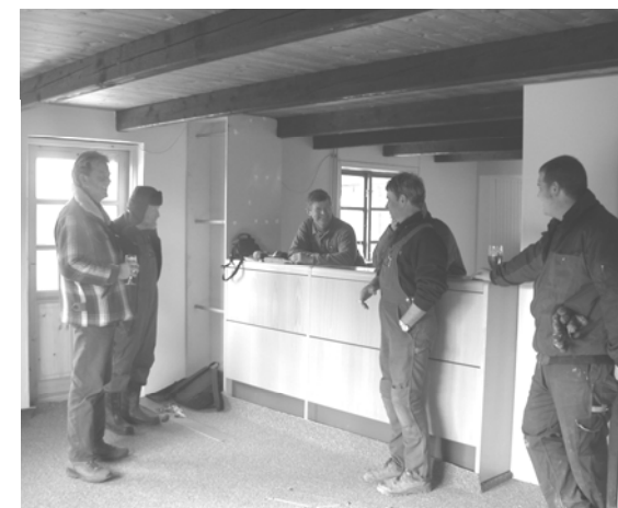
Der blev arbejdet hårdt for at få sekretariatet færdigt til ibrugtagning den 1. april.