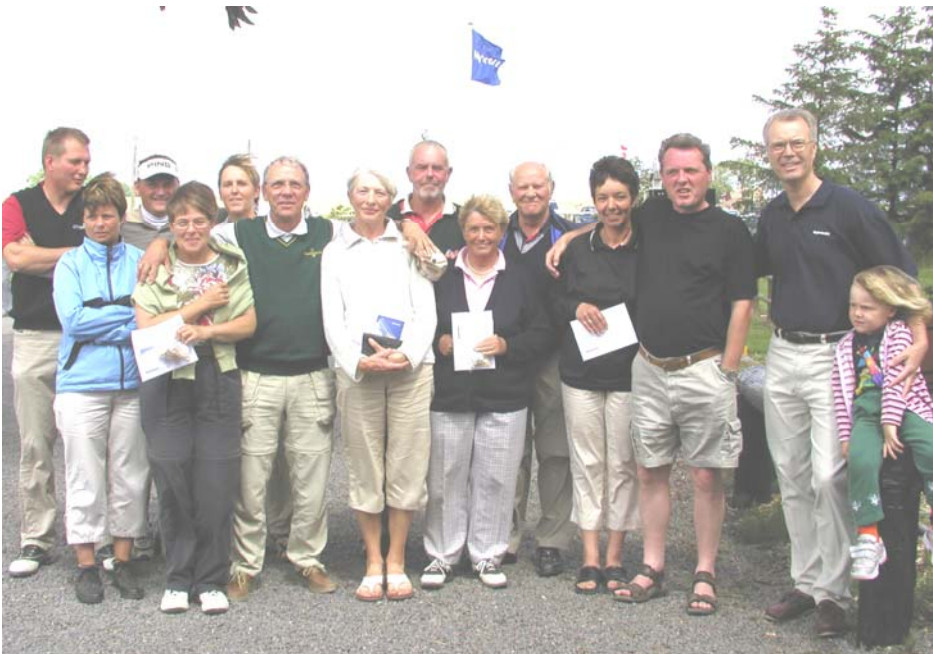
Vinderne i NYKREDIT ægteskabsmatchen.

Søndag den 4. juli havde 20 par mod på at stille op til denne, for damerne, store udfordring og alle klarede dagens strabadser uden at der opstod skilsmissegrundlag - sikkert fordi damerne spillede godt.