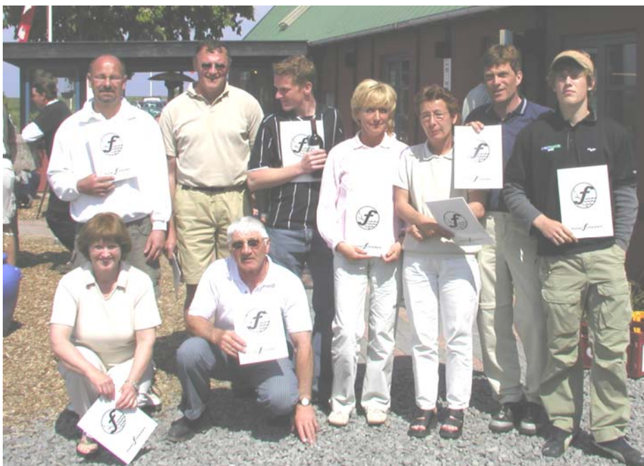
Vinderne i Hotel Friheden - pinsematchen.