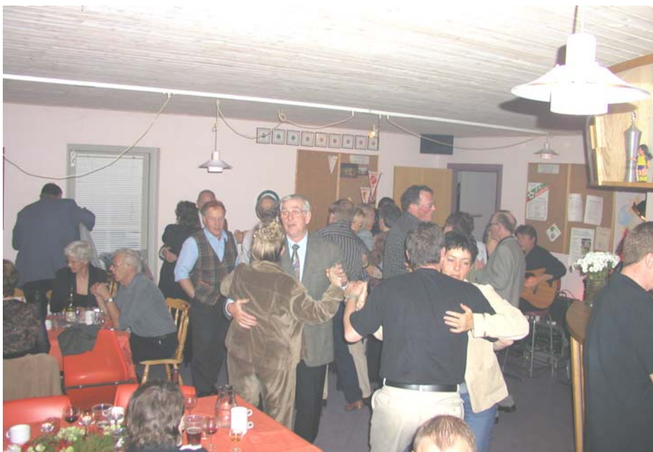
Der var trængsel på dansegulvet ved den meget vellykkede klubfest i Rø Idrætsfor- enings hus.