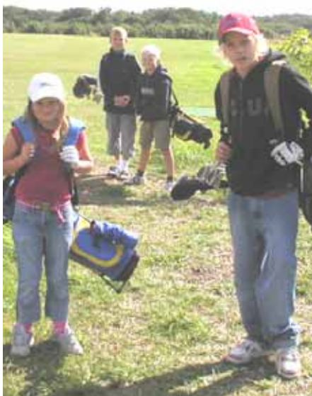
Juniorene klarede sig godt i sidste sæsons holdkampe mod Nexø

Det betyder også at en spiller med højere handicap har bedre chance, idet det ofte er stabiliteten der svigter, men det betyder ikke så meget i hulspil, hvor man blot taber hullet ved en fejl eller et par dårlige slag og så kan slå til på næste hul.